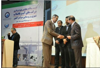
معاونت بهره برداری شرکت آب و فاضلاب استان زنجان رتبه برتر را کسب کرد