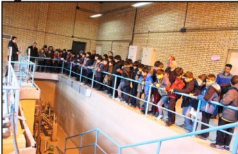
بازدید دانش آموزان دبستان پسرانه احرار از تصفیه خانه آب زنجان