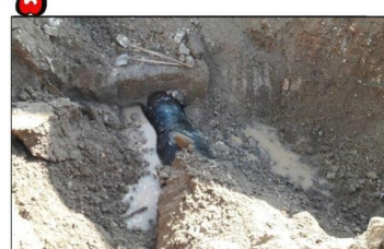
مدیر امور آبفای زنجان گفت: رفع نشتی خط انتقال ۱۰۰۰ بدون قطعی آب در شهرک پونک زنجان

معاون بهره برداری شرکت آبفای استان زنجان گفت: