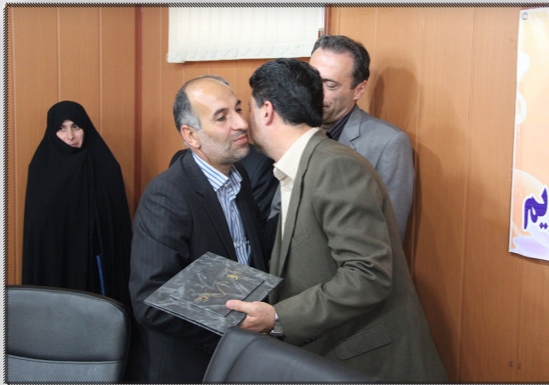
نشسته داخلی شرکت آب و فاضلاب استان قزوین

در این شماره می خوانید شرکت آبفای استان قزوین در برنامه های سوادآموزی به عنوان دستگاہ پرتسال ۹۱ شناخته شد ♦♦♦♦♦ بازدید مدیرکل بازرسی استان قزوین از آزمایشگاه شرکت آب و فاضلاب ♦♦♦♦♦ مدیرعامل شرکت آب و فاضلاب استان قزوین در جلسه تجلیل از ایثارگران: عزت و آبروی ما در شرکت آب و فاضلاب مرمون دعای خیر مردم به واسطه خدمت رسانی است