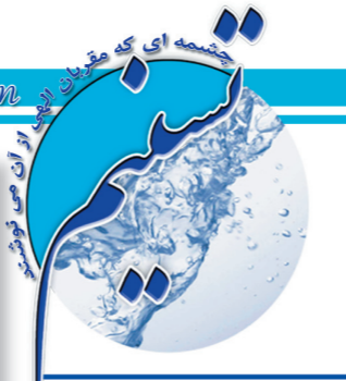
نشریه داخلی شرکت آب و فاضلاب استان قزوین

های در حال تایپ خسته می شوند و به دلیل جایجایی زیاد کلمات، چشم قدرت تطابق خود را به مرور از دست می دهد. افرادی که دارای اختلالات انکساری اصلاح نشده هستند بیشتر در معرض خطر هستند. ۲- عوارض مفصلی و عضلانی: یکی دیگر از شایع ترین عوارض کار با رایانه، دردهای عضلانی و درد مچ دست و بازوهاست. درد گردن و کمر و در درازمدت، خمیدگی پشت، از عوارض دیگر کار زیاد و طولانی با رایانه است. معمولاً کاربران رایانه، ساعدها، دست ها، بازوان، پشت و گردن خود را در یک حالت ثابت قرار می دهند و این عمل باعث وارد شدن فشار زیاد، در زمان طولانی، بر روی ماهیچه ها و تاندون های فرد می شود و در نهایت می تواند به مشکلات عضلانی و مفصلی نیز منجر شود. در این رابطه، فاکتورهای ارگونومیک نظیر بارکاری، حرکت تکراری، طرز نشستن، زاویه دید، وضعیت میز و صندلی، ارتفاع صفحه کلید و مانیتور، وضعیت نوری، سرعت تایپ، عدم آرامش روانی و... می تواند از فاکتورهای عمده خطر باشد. استرس و مشکلات عصبی - روانی: حجم کار زیاد و دوری از همکاران در محیط کار می تواند منجر به بروز مشکلات روانی شود. البته لازم به ذکر است که کار با کامپیوتر افسردگی را نیست بلکه حجم زیاد کار است که در ایجاد استرس روانی نقش دارد.