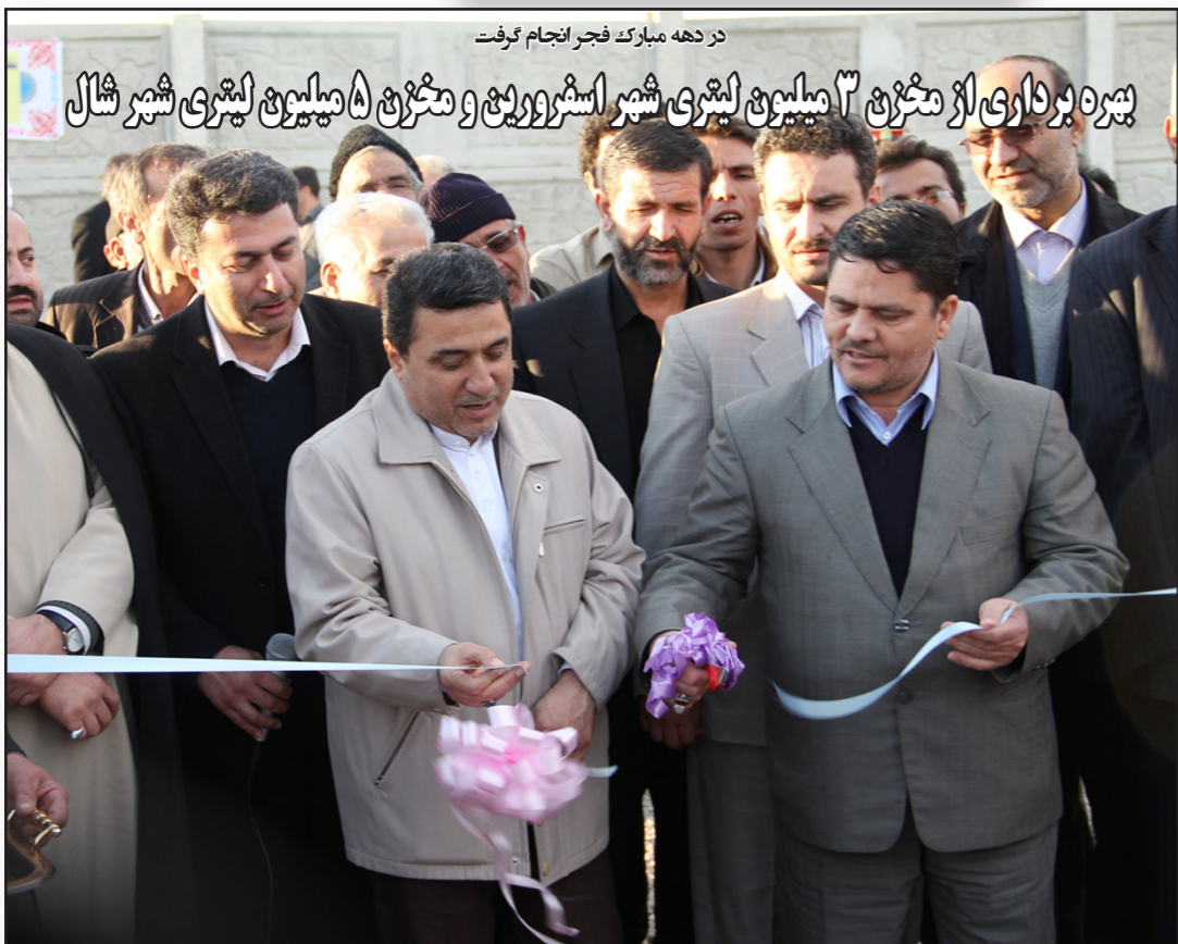
در دهه مبارک فجر انجام گرفت

بهره برداری از مخزن ۳ میلیون لیتری شهر اسرور و مخزن ۵ میلیون لیتری شهر شال