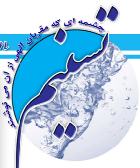
نشریه داخلی شرکت آب و فاضلاب استان قزوین