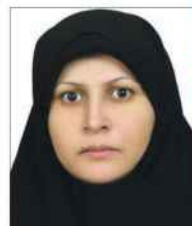
عضو هیات مدیره جامعه حمایت از عناصر طبیعی و محیط زیست: (سازمان مردم‌نهاد و فعال فرهنگی)

محدودیت مواجه می‌سازد. مدیرعامل شرکت آب و فاضلاب روستایی استان کرمانشاه در پایان با اشاره به اینکه فرایند اصلاح الگوی مصرف موضوعی است که فقط مختص به دولت نمیباشد، یادآور شد: این امر همه‌آحاد جامعه را درگیر مینماید زیرا در این فرآیند از افراد و شهروندان گرفته تا سازمانها و نهادهای دولتی باید همگی با تعهد و آگاهی اجتماعی نسبت به این مهم توجه نمایند.