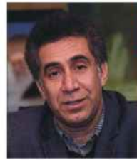
مدیر عامل شرکت آب و فاضلاب روستایی استان کرمانشاه: