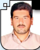
گردآوری: حسین محمدی

در گودبرداری های کوچک تر، مقایسه بین استفاده از مهار بندی عرضی یا اجرای دیواره گود به صورت شیبدار و انتخاب یکی از این دو گزینه بستگی به میزان فضای قابل دسترسی و نیز ملاحظات اقتصادی دارد .