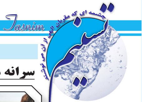
نشریه داخلی شرکت آب و فاضلاب استان قزوین

در این شماره می خوانید دریافت گواهینامه کفایت تخصصی آزمون PT توسط واحد کنترل کیفیت بهداشت معاونت بهره برداری شرکت آبفای استان قزوین مدیرعامل شرکت آبفای استان قزوین: خانواده معظم شهدا از بزرگترین سرمایه های انقلاب اسلامی هستند مدیرعامل شرکت آبفای استان قزوین در بازدید فرماندار تاکستان از تصفیه خانه فاضلاب: تکمیل ۲۰۰ کیلومتر شبکه و تصفیه خانه فاضلاب تاکستان نیازمند ۴۰ میلیارد تومان بودجه است