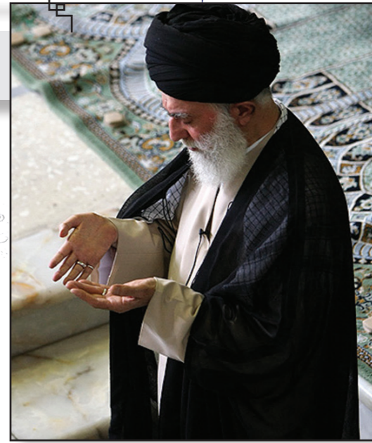
«انسان همیشه به نماز محتاج است و در عرصه های خطر محتاج تر»

که در موقع خواندن نماز زیاد به آداب و حدودش مقید نباشد، سعی نکنند که آن شرایط فضیلت را مراعات کند، بطور کلی سبک بشمارد. یکی از صور سبک شمردن تاخیر از اول وقت است ولی ممکن است یکی در اول وقت هم بخواند ولی به شرایط آداب و حدودش چندان پا بند نشود، با عجله بخواند، حضور نداشته باشد. البته بعدها در دنباله این صحبت در ادب حضور و خشوع، آداب را ذکر می کنیم. در اینجا حضرت زهرا سلام... علیها سوال می کند که کسی که نمازش را سبک بشمارد چه می شود؟ اول این است که خدا برکت را از عمر او برمی دارد؛ این عمر که من و شما می کنیم، برکت از آن برداشته می شود که انسان نداند که چه کرد، از کارهای خیر، نه از شر؛ مثلاً کسانی می بینید عمرشان با برکت است، خوب عبادت می کنند، خدمات زیاد می کنند «قال رسول... (ص): یا فاطمه من یتهاون بصلاته من الرجال والنساء»، فرمود: یا فاطمه کسی که نمازش را سبک بشمارد از مردها و زنها، «ابتلاه... بخمس عشرة خصله»، خدا او را به ۱۵ خصلت مبتلا می کند (خیلی تهدید کننده است)، «ست منها فی دار الدنیا و ثلاث عند موتها و ثلاث فی قبره و ثلاث فی القیامه اذا خرج من قبره»، شش تا در زندگی دنیا و سه تا در وقت مرگ و سه تا در قبر و برزخ و سه تای دیگر در قیامت است وقتی از قبرش خارج می شود.