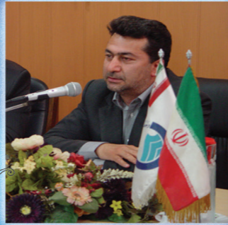
نشریه داخلی شرکت آب و فاضلاب استان قزوین

با سلام خداوند بزرگ و متعال را سپاس فراوان میگویم که باز فرصتی دوباره به ما عطاء فرمود تا بهاری دیگر که فصل شکوفایی و نو شدن است را بتوانیم شاهد باشیم و در مکتبی به وسعت الطاف بی کران او، درس زندگی، درس محبت و درس انسانیت بیاموزیم. ما نیز در فصلی که نوید دهنده نو شدن هاست برآنیم که نو شویم و این موضوع جز در پرتو الطاف الهی میسر نخواهد بود. به درگاه الهی امیدوریم که گناهانمان را عفو نماید و همچنان راهنمای راهمان باشد. جای بسی خوشحالی است که عمر به ما فرصت داد تا یک سال را پشت سر گذرانیم و آغازی دوباره را شروع کنیم. امیدوارم سالی که به هر طریق از آن گذشتیم بر شما خوش گذشته باشد و هرچه در آن از خوبی داشته ایم همچنان حفظ کرده و هر چه بدی بوده را به کام فراموشی بسپاریم. امیدوارم همه ما در راستای تعالی روح و معنویت خود گام هایی اساسی بر داشته و در جهت تقویت ایمان خود کوشش نماییم. اینجانب سالی پر از مهر، محبت و سلامتی برایتان آرزومندم و صمیمانه ترین تبریک ها را به مناسبت فرا رسیدن نوروز ۱۳۹۲ تقدیمتان میکنم.