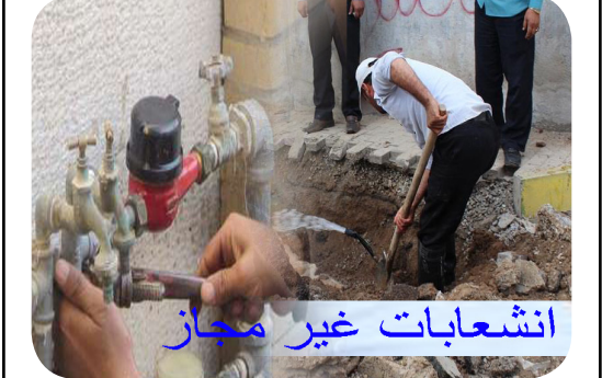
انشعابات غیر مجاز

به گفته ذوالجناحی، ۳۵ انشعاب غیر مجاز دیگر نیز از طریق مراجع قضایی شهرستان نیشابور در حال پیگیری حقوقی است.