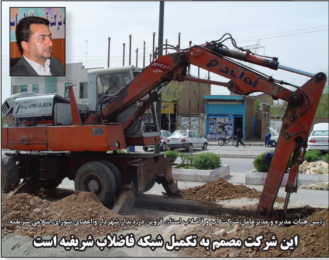
رئیس هیات مدیره و مدیر عامل شرکت آب و فاضلاب استان قزوین در دیدار شهردار و اعضای شورای اسلامی شریفیه است این شرکت مصمم به تکمیل شبکه فاضلاب شریفیه است

در این شماره می خوانید حضور شرکت آبفای استان قزوین در همایش فرماندهان بسیج صنعت آب و برق کشور اقدامات انجام گرفته در شرکت آبفای استان قزوین در سایه همت مضاعف و کار مضاعف در سال ۸۹ به روایت اداره روابط عمومی شرکت مهندسی آبفای کشور احداث ساختمان اداری آب و فاضلاب شهر رازمیان شهرستان قزوین به اتمام رسید