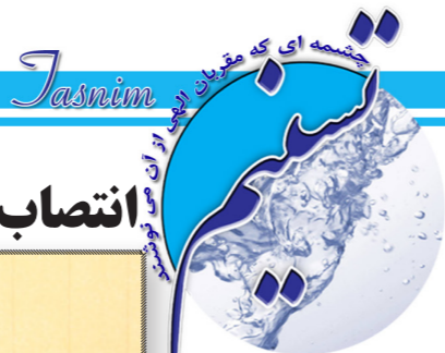
نشریه داخلی شرکت آب و فاضلاب استان قزوین