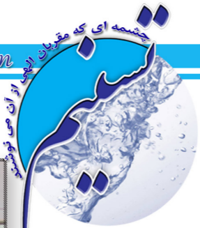
تشریحی داخلی شرکت آب و فاضلاب استان قزوین