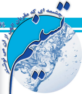
تشریح داخلی شرکت آب و فاضلاب استان قزوین