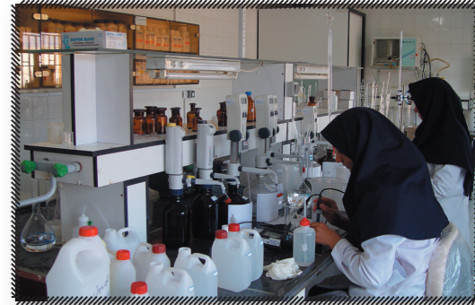
شرکت آب و فاضلاب استان قزوین به عنوان شرکت برتر در زمینه بکارگیری سامانه مدیریت اطلاعات آزمایشگاهی

انتخاب شد. به گزارش روابط عمومی شرکت آب و فاضلاب استان قزوین، این شرکت از سوی شرکت مهندسی آبفای کشور به عنوان یکی از شرکت های برتر در زمینه بکارگیری سامانه مدیریت اطلاعات آزمایشگاهی (LIMS) انتخاب شده و توسط حمید رضا تشییعی معاون نظارت بر بهره برداری شرکت مهندسی آبفای کشور از واحد کنترل کیفیت و بهداشت آب این شرکت نیز تقدیر و تشکر گردید. در متن لوح تقدیر معاون نظارت بر بهره برداری شرکت مهندسی آبفای کشور آمده است: به این وسیله