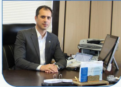
صفحه ۲ مدیرعامل شرکت آب و فاضلاب استان زنجان خبر داد : آئین نامه بهبود بهره وری شرکت آبفای استان زنجان تدوین شد