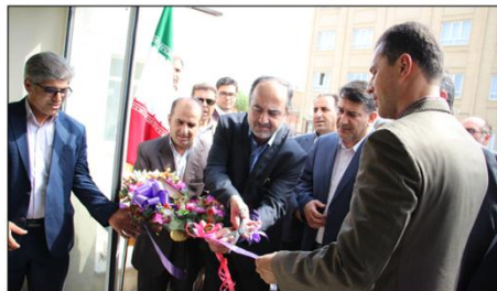
مدیر عامل شرکت آب و فاضلاب استان زنجان خبر داد:

وی همچنین به حفر و تجهیز یک حلقه چاه در شهر صائین قلعه اشاره کرده و گفت: این طرح همراه با اجرای خط انتقال با ۶ میلیارد و ۷۶۰ میلیون ریال اعتبار به بهره برداری می رسد که با اجرای مجموع این طرح ها شاهد خدمات رسانی بیشتر به مشترکین آب و فاضلاب در شهر های استان زنجان خواهیم بود.