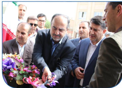
صفحه ۳ مدیرعامل شرکت آب و فاضلاب استان زنجان خبر داد : ساختمان اداری امور آبفای شهرستان ابهر افتتاح شد