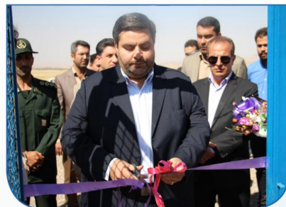
صفحه ۳ مدیرعامل شرکت آب و فاضلاب استان زنجان خبر داد : مخزن ۱۰۰۰ متر مکعبی شهر ارمغانخانه افتتاح شد