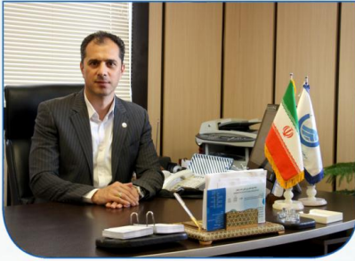
مدیرعامل شرکت آب و فاضلاب استان زنجان صفحه ۲ خبرداد:

افتتاح و آغاز عملیات اجرایی ۱۱ طرح آبرسانی در هفته دولت