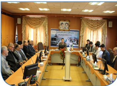
مدیرعامل شرکت آب و فاضلاب استان زنجان صفحه ۳ عنوان کرد:

افتتاح و آغاز عملیات اجرایی ۱۱ طرح آبرسانی در هفته دولت