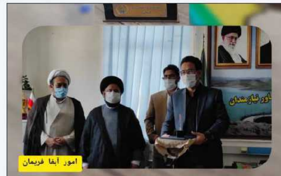
امور آبفا فریمان

با توجه به مشکل آب شرب مجتمع زوباران مشتمل بر ۱۱