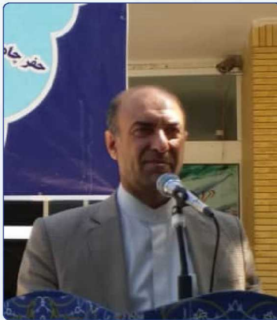
فرماندار اعلام کرد: