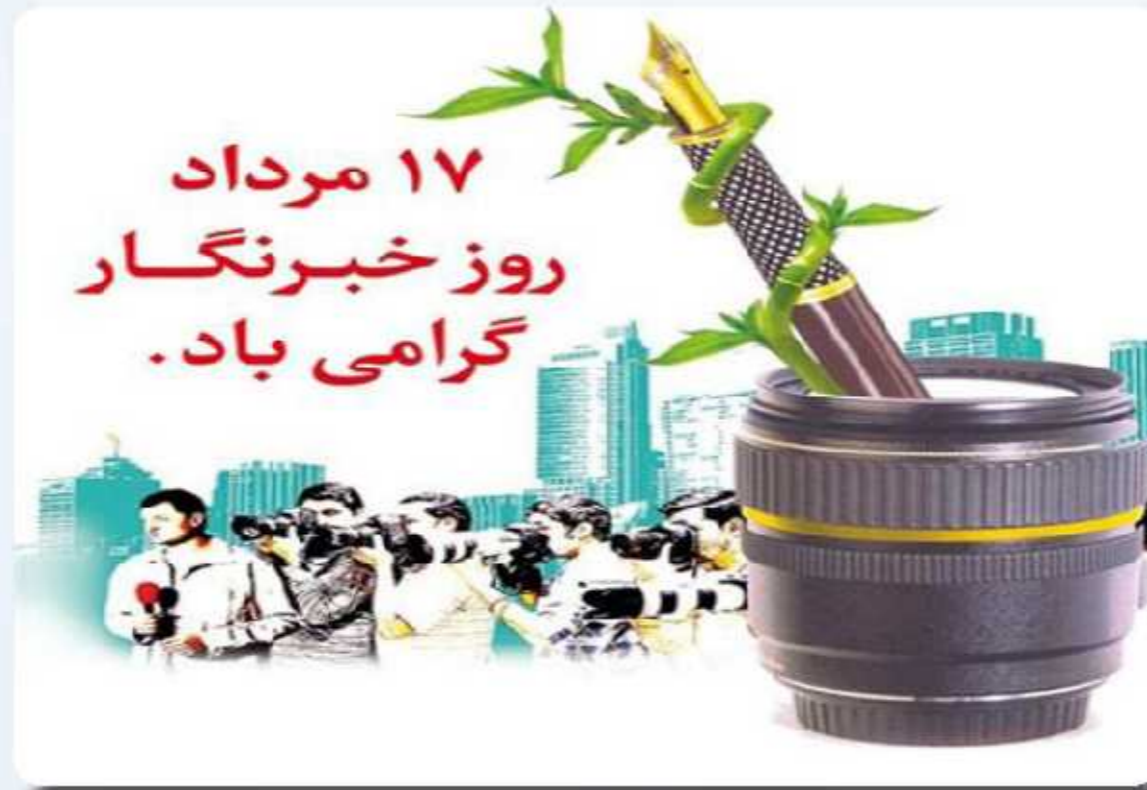
به بهانه ۱۷ مرداد روز خبرنگار