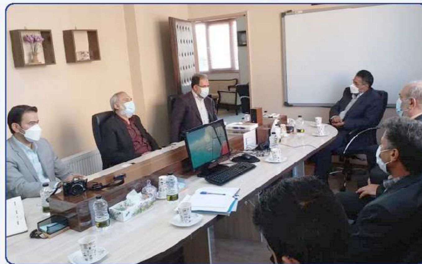
از سوی آبفا خراسان رضوی ارائه شد: