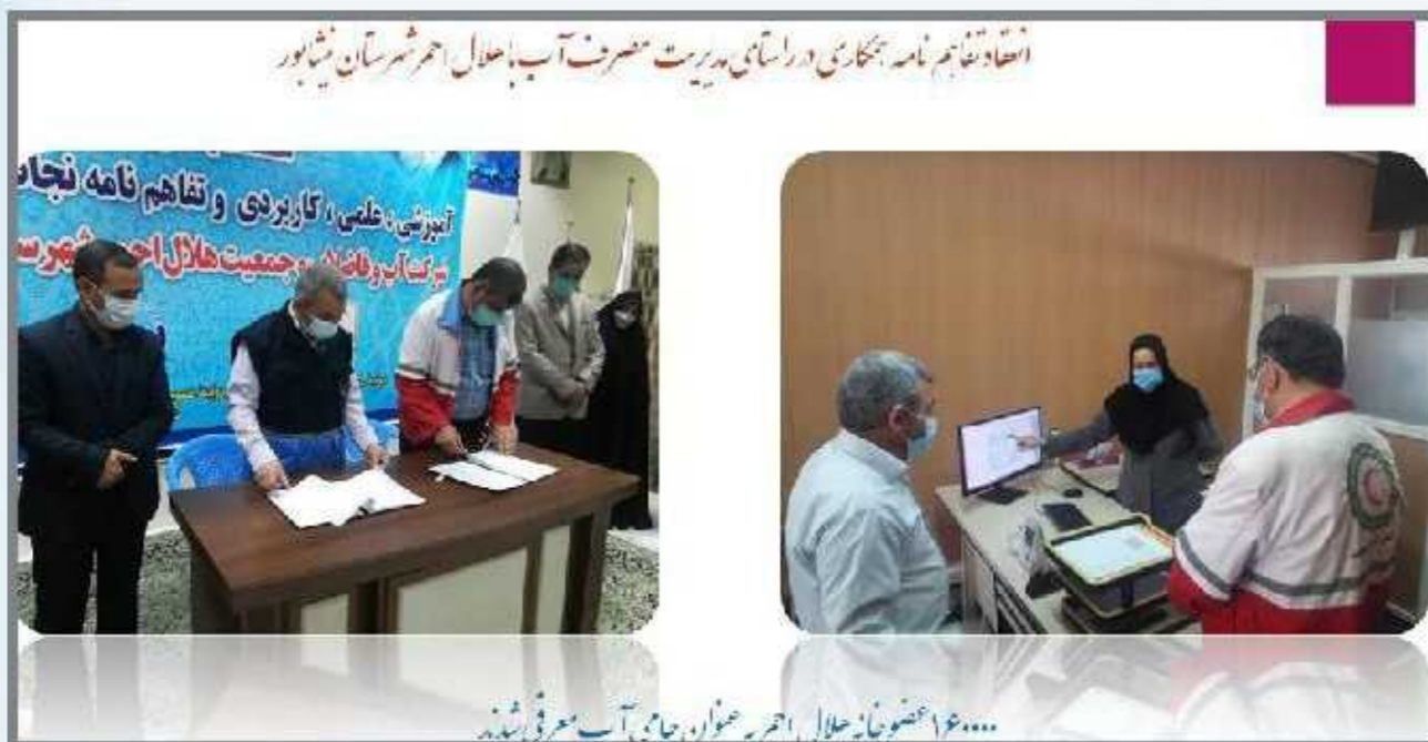
انقاد تفاهم نامه همکاری در راستای مدیریت مصرف آب با هلال احمر شهرستان نیشابور