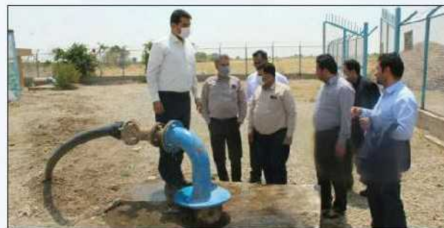
با بهره برداری از منبع جدید آبی روستاهای تحت پوشش

مجتمع قلعه یزدان شهرستان فیروزه، زمینه آبرسانی پایدار به ساکنان این روستاها فراهم شد. در این مراسم که بخشدار طاغنکوه، معاون سیاسی فرماندار و سایر مدیران شهرستان حضور داشتند، فرماندار فیروزه از تلاش و عملکرد امور آبفای در آبرسانی مناسب و تامین آب تقدیر کرد و از مردم خواست با توجه به کاهش منابع آب زیر زمینی صرفه جویی داشته باشند.